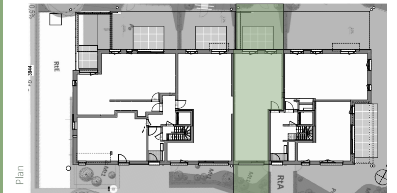
Plan Façade jardin / Gevel tuinkant

- Toiture verte / bac à plantes groendak / plantenbak